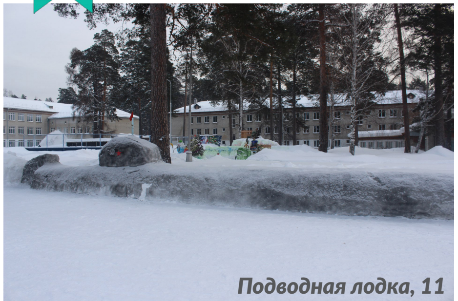
Подводная лодка, 11