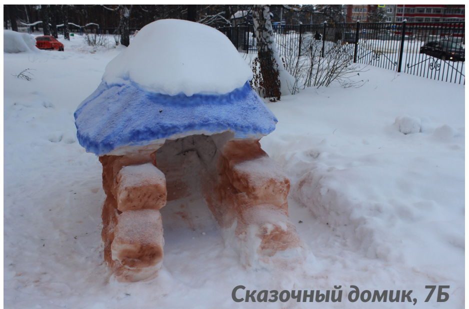
Сказочный домик, 7Б