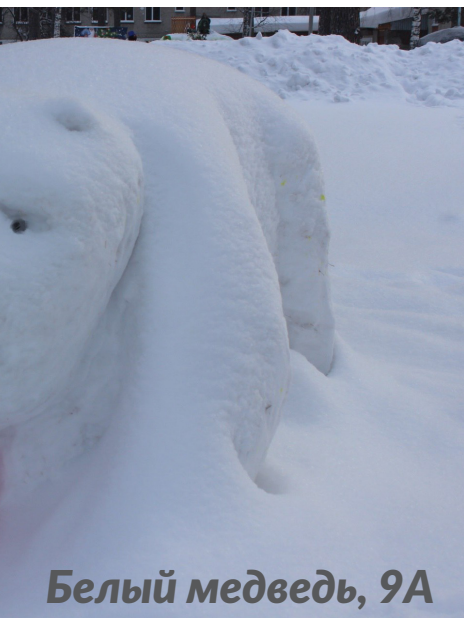
Белый медведь, 9А